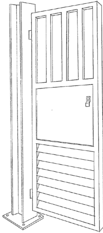
大工崗位(鉄器噴漆)透視圖