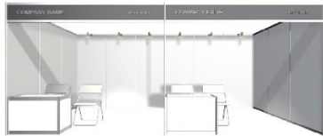
*展位配設高級設備