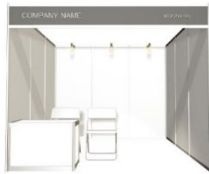
**展位配設標準設備