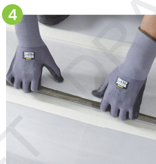
清理地面多餘膠漿