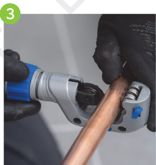
3 切割銅管至合適長度