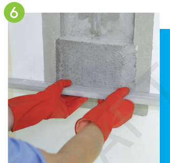
6 用壓尺盪平水泥沙漿，並確保沙漿壓實，填飽飽滿、平整，最後進行飾面處理