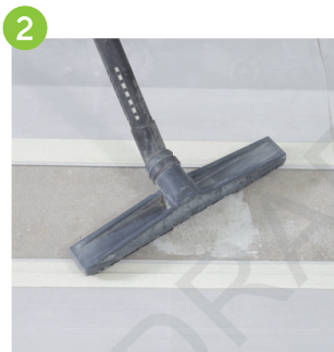
使用吸塵器清理地面