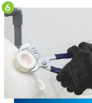
6 完工前將所有管碼、排水管配件修理口及隔氣接駁口收緊