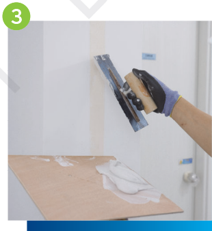
3 於紙帶上再以紙帶灰物料進行批填漆灰