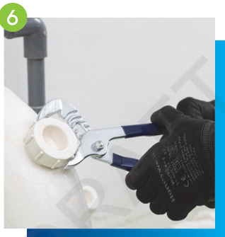
6 完工前將所有管碼、 排水管配件修理口及 隔氣接駁口收緊