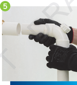
5 進行分支排水管及隔氣的接駁