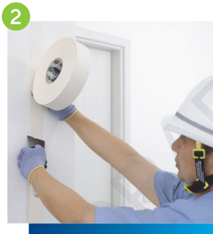
2 以紙帶覆蓋已批灰之接駁口