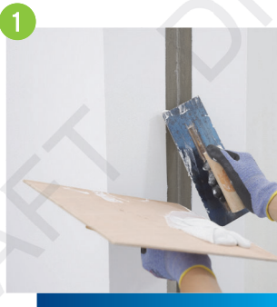
1 於接駁口位置進行物面處理及清潔，並使用紙帶灰批填漆灰