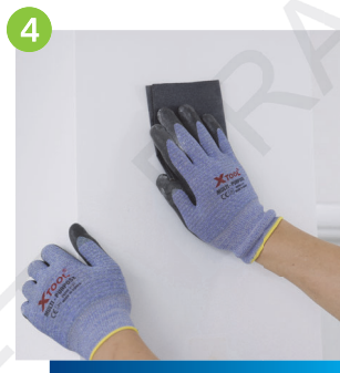
4 將漆灰面進行打磨處理