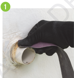
1 清潔外牆MIC排水管接駁口