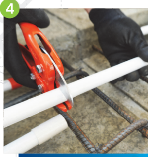
4 切割合適長度的燈喉