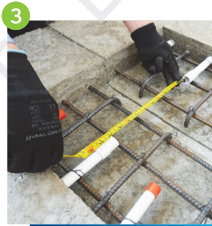
3 量度接駁燈喉的長度