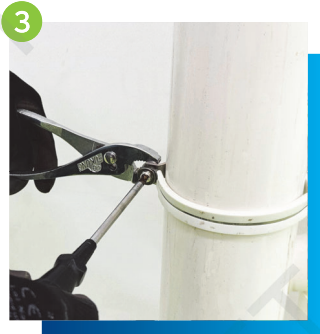
3 安裝企身去水管及沖廁水喉管, 注意調節三叉的高度及斜水