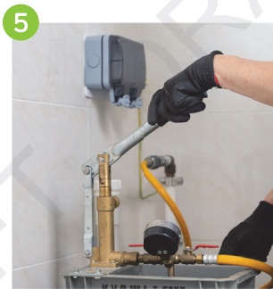
5 完工前進行水壓測試，確保供水系統沒有滲漏