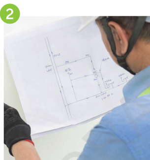
2 按批核管線圖紙進行開料及安排佈管