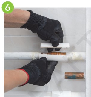
6 最後在焊接接駁口包裹「蝦殼」飾面