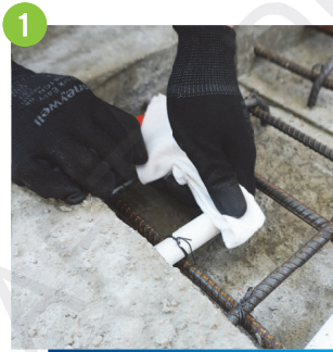
1 施工前需要清理套通接駁口的混凝土沙漿，並確保沒有異物阻塞在管道內