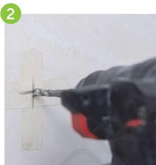
2 於牆身鑽孔安裝管碼（如需要）