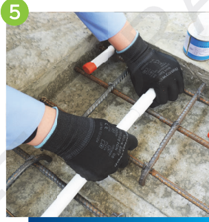
5 塗上適量黏合劑進行接駁工序，注意接駁處須確保緊貼、牢固可靠及無鬆動