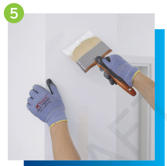
5 為整體牆身進行最後一層油漆施工，並確保牆身漆面平整、順滑及髹漆色調一致