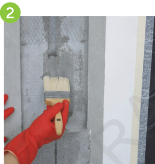
2 在接駁批盪收口位，塗刷黏合防水膠漿（需用工地批核的物料）