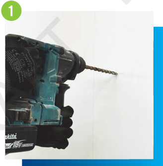
1 按照魚絲的定位進行鑽孔 工序及安裝平爆螺絲, 鑽孔時需注意深度(如需要)