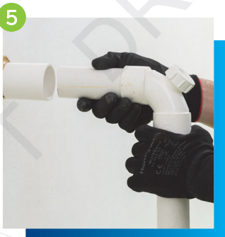
5 進行分支排水管及隔氣的接駁