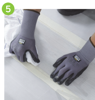
完工前檢查地板接駁位置平整度