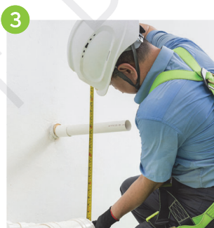
3 先接駁較大型的主排水管，注意橫喉斜水坡度，其後量度分支排水管尺寸，留意垂直度