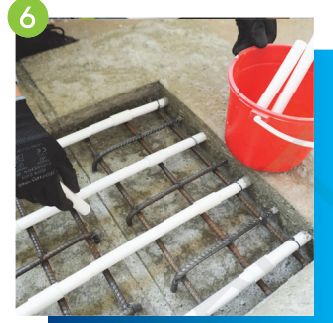
6 確保接駁口穩妥黏合及沒有縫隙，最後清理工具及餘下物料