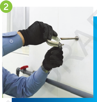
2 按照魚絲的定位安裝螺絲碼, 注意定位後需鎖緊螺絲帽 (如需要)