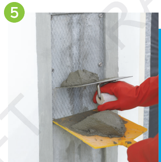
5 將混和好的水泥沙漿，按序批在接駁收口位置上（注意在物料指定要求時間內進行）