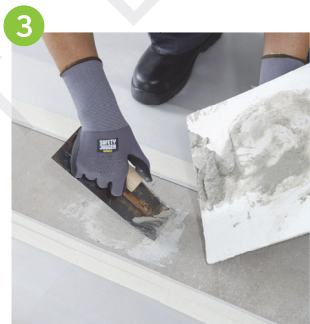
選擇水溶性地板膠漿 用有灰匙刮膠漿