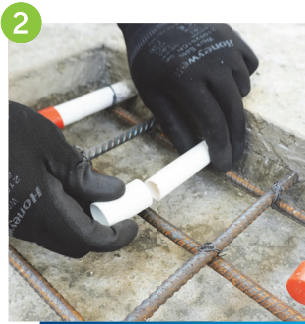
2 燈喉須有套筒(疏結)直接接駁，並塗上適量黏合劑