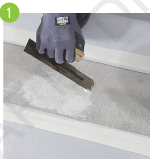
於接駁口位置進行物面處理及清潔,並使用混合填充物料整理凹凸不平地面