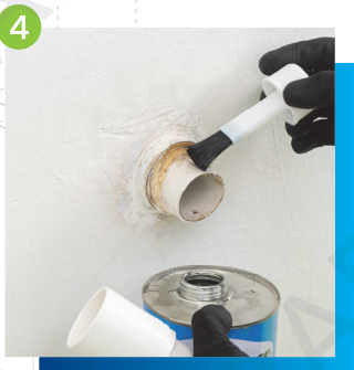
4 在管身外面及配件內部 塗上適量已批核的黏合劑