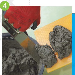
4 按工程批核要求，以指定防水膠漿及混和比例，製作批盪水泥沙漿