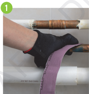
1 清潔供水管接駁口，並確保沒有異物阻塞在管道內