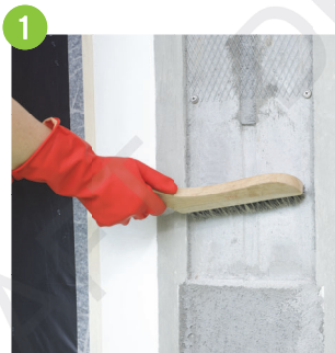
1 清潔混凝土表面灰塵