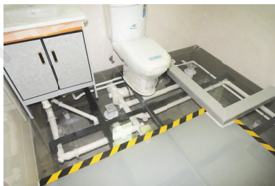
下沉式樓板設計廁所將大部分喉管藏於廁所室內底部及假天花之上,於外牆來去水接駁收口工序相對一般廁所設計較少(左圖為下沉式樓板設計廁所模擬樣板)