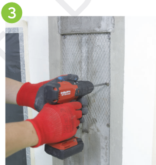
3 以不鏽鋼螺絲安裝批盪網（俗稱：雞仔網），螺絲定位間距不多於150mm