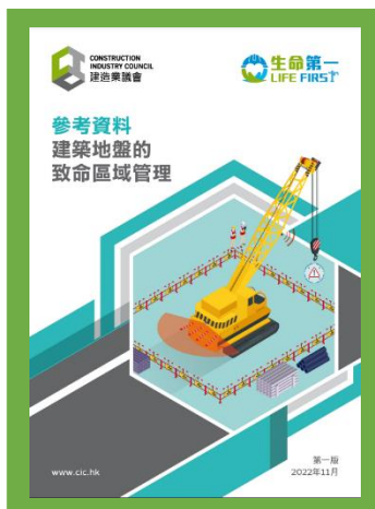
參考資料 - 建築地盤的致命 區域管理