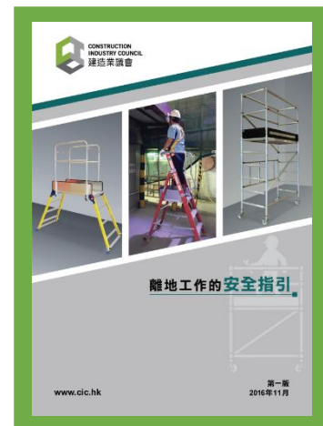
離地工作的安全指引