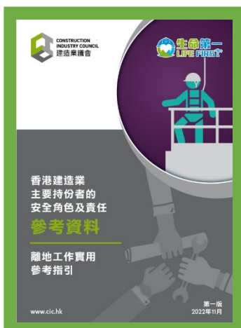
參考資料 - 香港建造業主要持份者的安全角色及責任 (離地工作實用參考指引)