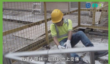
「高處工作 - 金屬架和梯具」安全短片