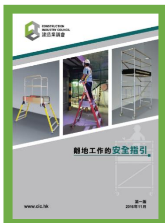
離地工作的安全指引