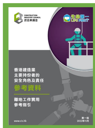
參考資料 - 香港建造業主要持份者的安全角色及責任 (離地工作實用參考指引)