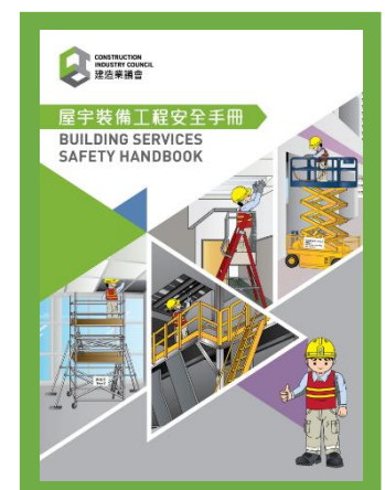
屋宇裝備工程安全手冊