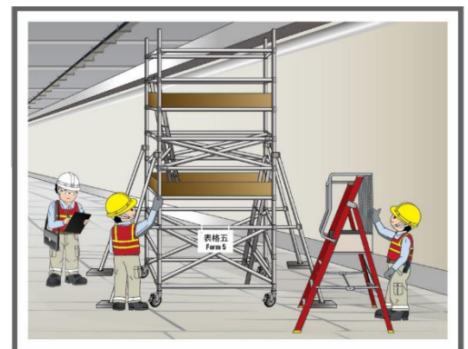
使用合適的工作平台（例如：輕便工作台或流動工作平台）