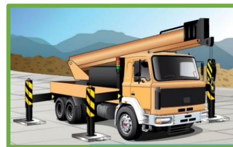
起重機設置地點需為穩固的地面並能足夠承托起重機及負荷物的重量