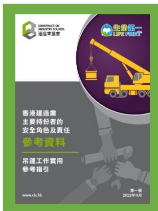
參考資料 - 香港建造業主要持份者的安全角色及責任 (吊運工作實用參考指引)