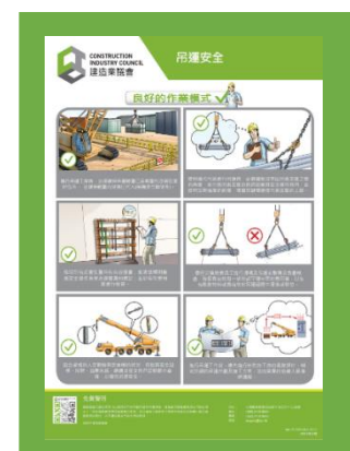
海報 - 吊運安全