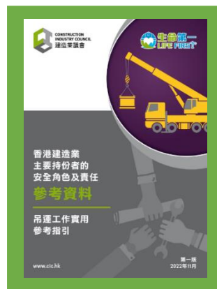
參考資料 - 香港建造業主要持份者的安全角色及責任 (吊運工作實用參考指引)