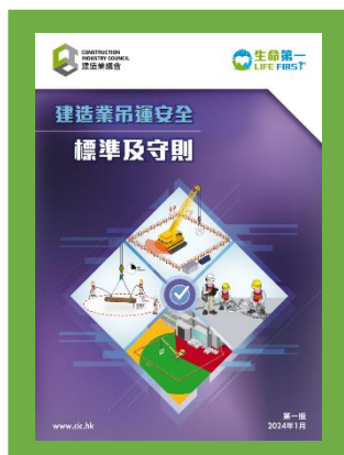
建造業吊運安全標準及守則