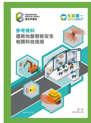
參考資料 - 建築地盤智能安全 相關科技指南