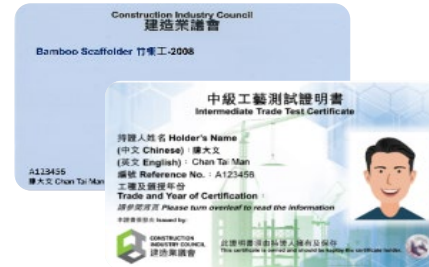
「中級工藝測試」( 俗稱「中工」) 證明書樣本