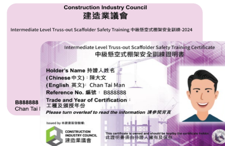
「中級懸空式棚架安全訓練」證明書樣本