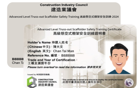
「高級懸空式棚架安全訓練」證明書樣本