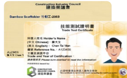
「技能測試」( 俗稱「大工」) 證明書樣本