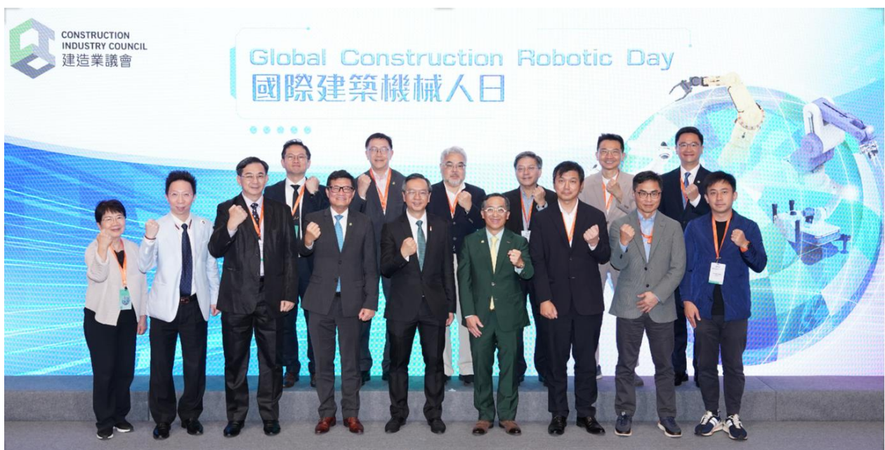
國際建築機械人日論壇下午部分嘉賓合照