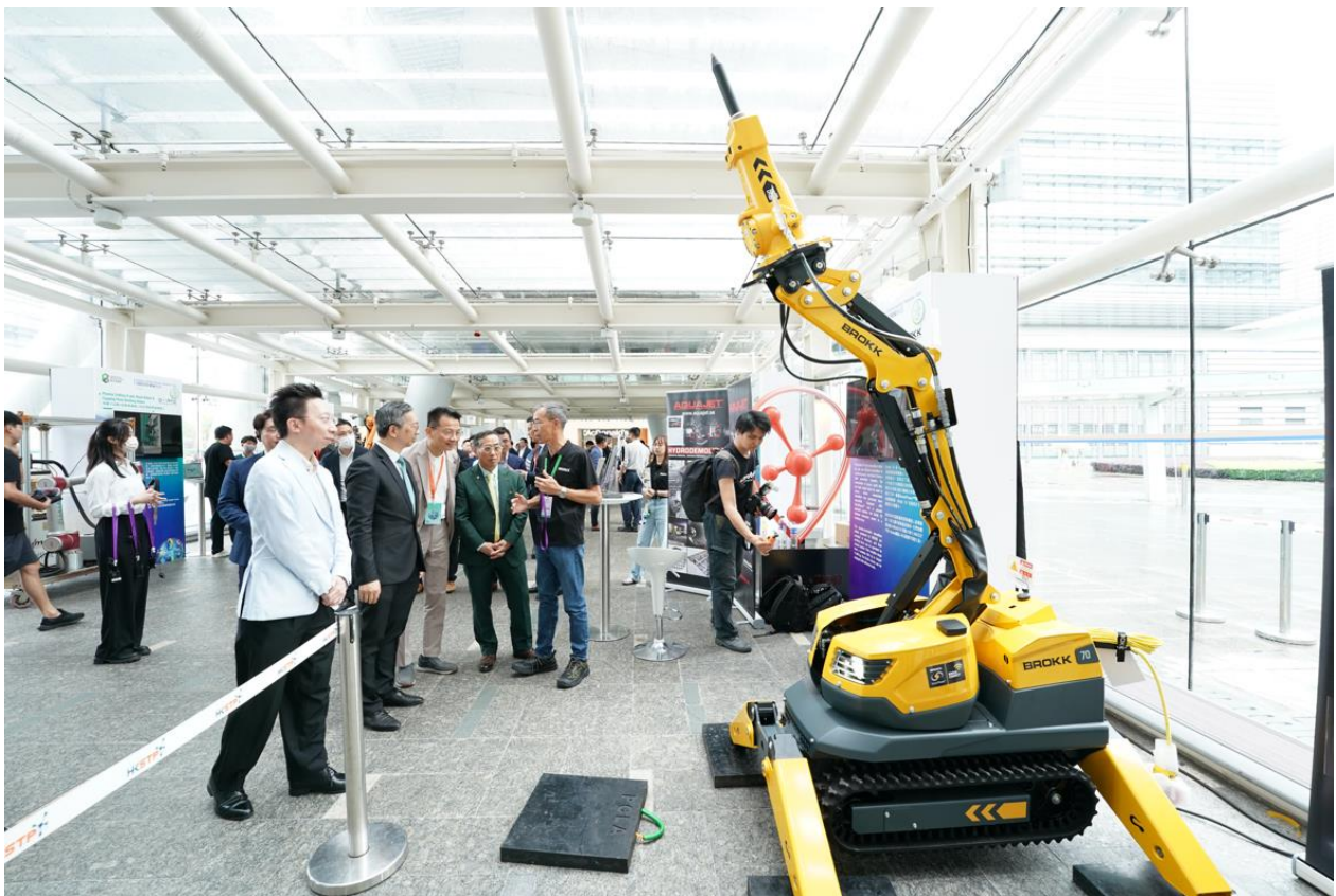
展覽展出了 24 台頂尖技術的建築機械人