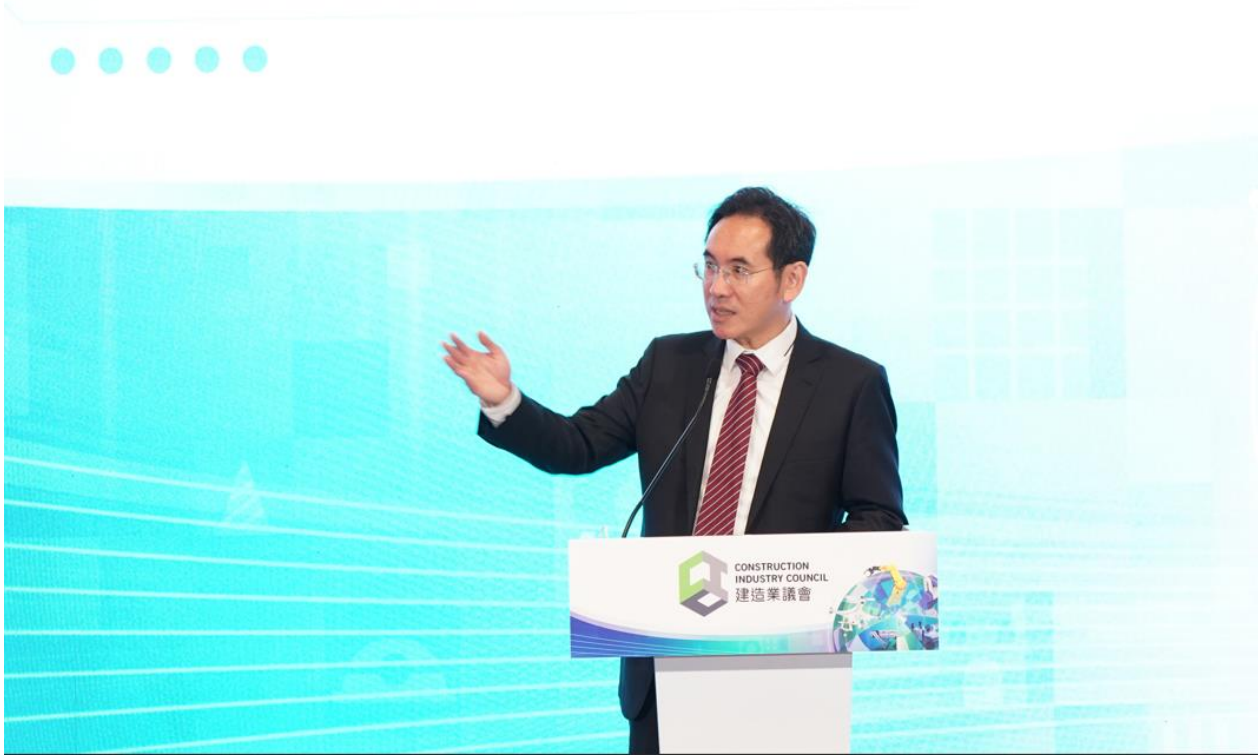
發展局副局長林智文先生於國際建築機械人日論壇上午部分致開幕辭