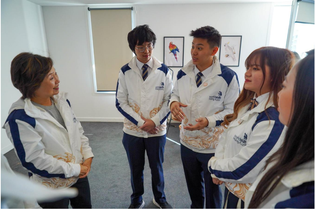
教育局局長蔡若蓮博士（左）與一眾代表香港的選手會面