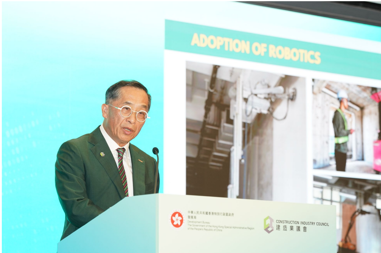
建造業議會主席何安誠教授工程師於開幕典禮致歡迎辭