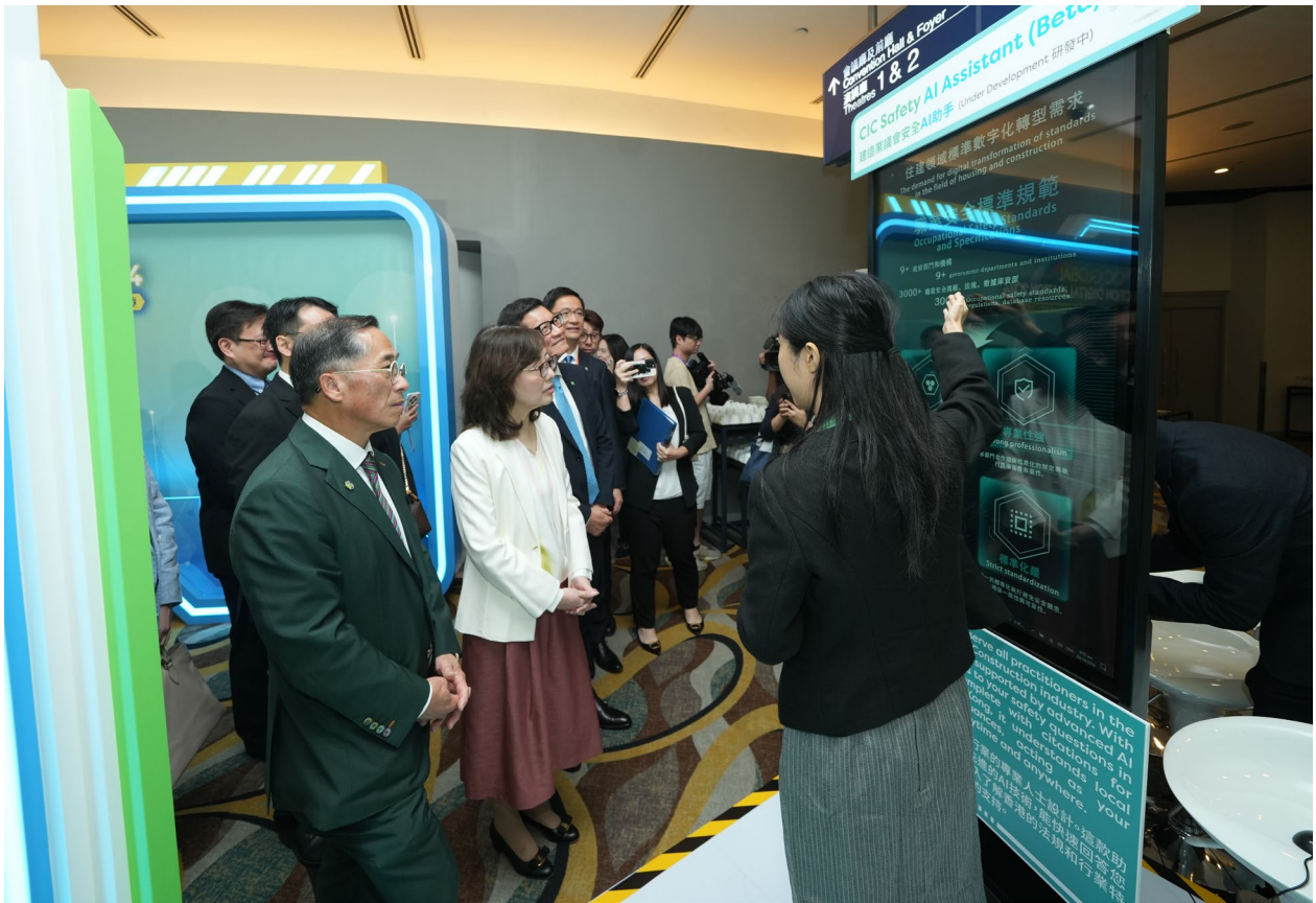
發展局局長甯漢豪女士參觀展覽，了解建造業創新現況