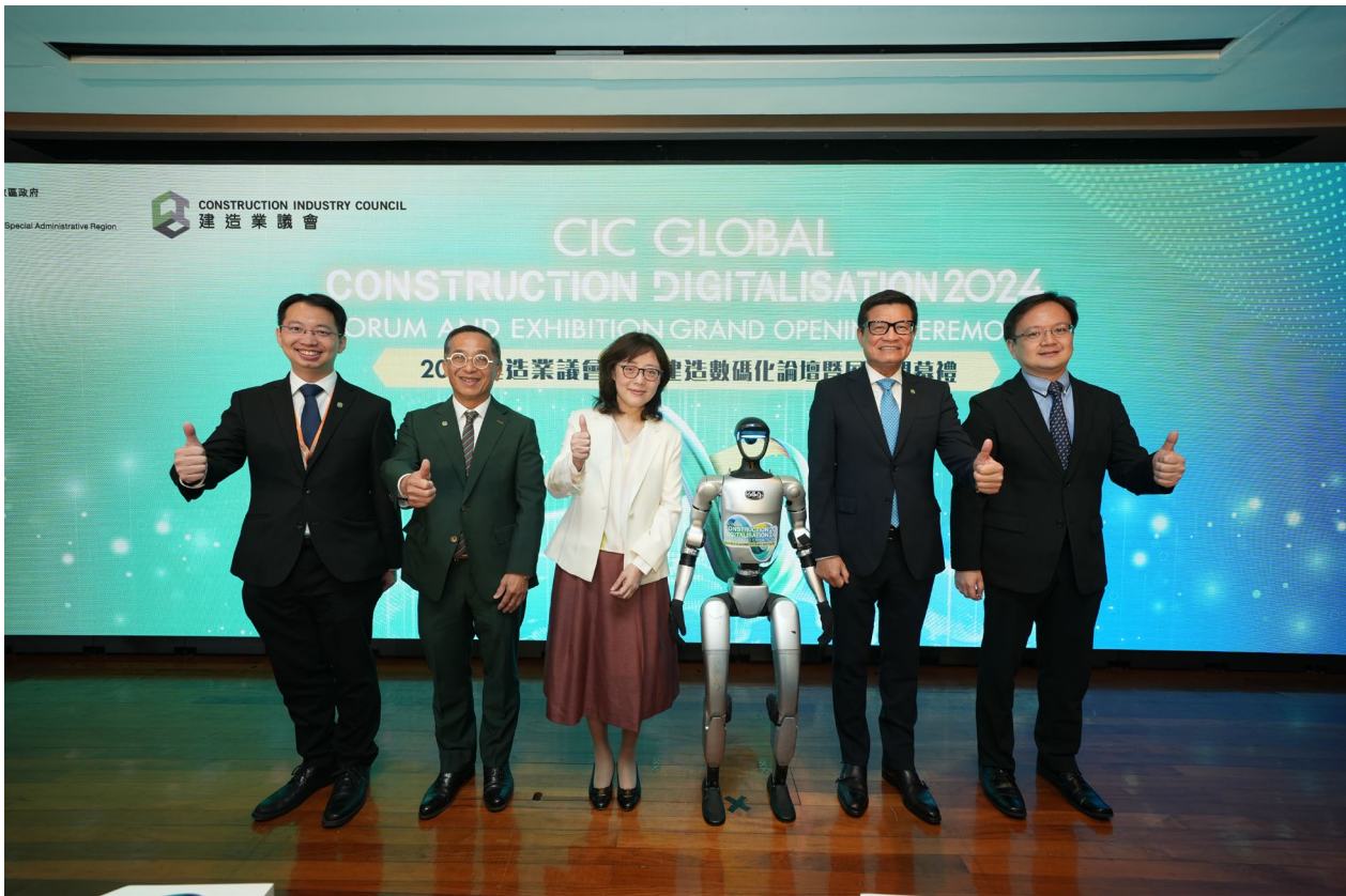
發展局局長甯漢豪女士（中）、建造業議會主席何安誠工程師（左二）、建造業議會執行總監鄭定寧工程師（右二）、發展局項目策略及管控處處長羅國權先生（右一）及 GCDFE 籌備委員會主席鄭展鵬教授（左一）共同主持開幕儀式