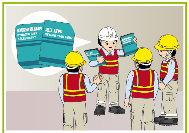
工作開展前進行講解及進行動態風險評估。