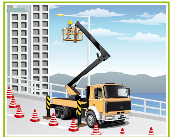
盡量使用合適的工作台進行高處工作。

以上只列出安全重點，詳細內容請參閱 勞工處發出的《建築地盤(安全)規例》、路政署的《道路工程的照明、標誌及防護工作守則》及建造業議會的安全提示第003/16號《道路維修工程的安全》。