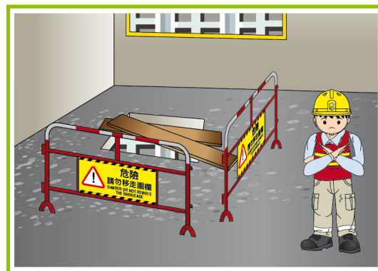
工友如發覺工作地點不安全或個人防護裝備不足夠，應立即停工，並向主管匯報。