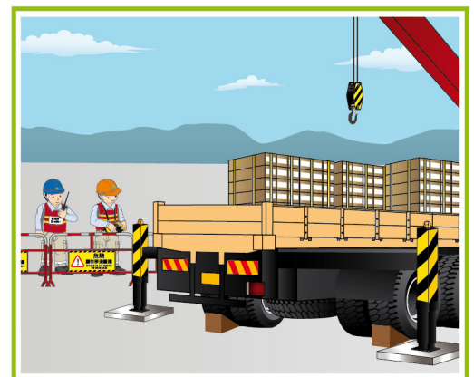
確保吊運範圍妥善圍封

以上只列出安全重點，詳細內容請參閱《工廠及工業經營(起重機械及起重裝置)規例》、勞工處發出的《安全使用流動式起重機工作守則》及建造業議會發出的《安全吊運手冊》。