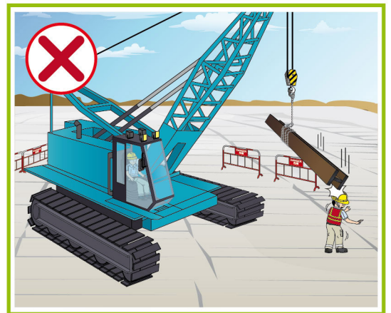
吊運路線不可在其他人之上經過