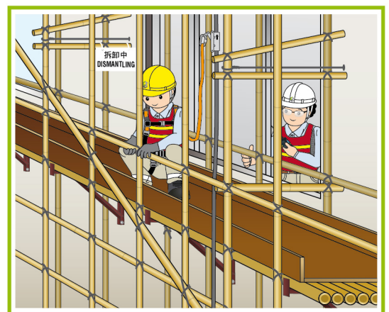
由合資格人士監督。