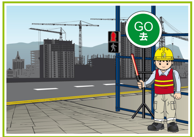
委任交通控制員，以管理及控制工地交通。