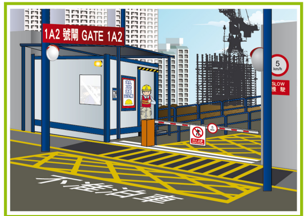
制定完善的工地交通管理計劃。