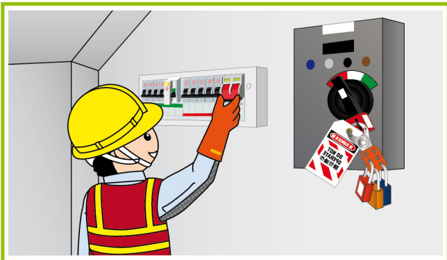
3. 定期檢查電力線路及設備。