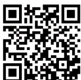
防火安全 - 弧焊