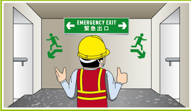
1. 清楚劃定逃生路線及定期檢視。