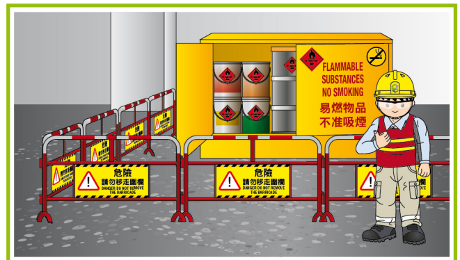
6. 維持良好工地整理及妥善存放易燃物品。