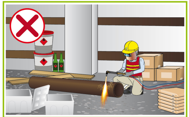
切勿在易燃物品附近進行熱工序。