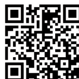
防火安全 - 油漆易燃液體