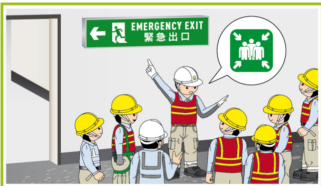
5. 委任防火專員及定期進行消防演習。