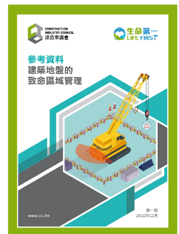
參考資料 — 建築地盤的 致命區域管理