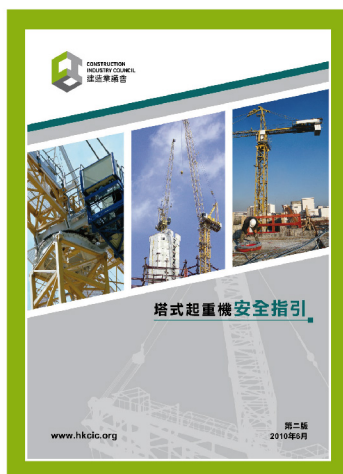
塔式起重機安全指引