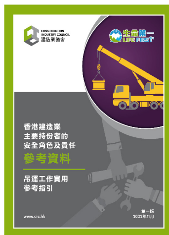
參考資料 — 香港建造業主要持份者 安全角色及責任 (吊運工作實用參考指引)