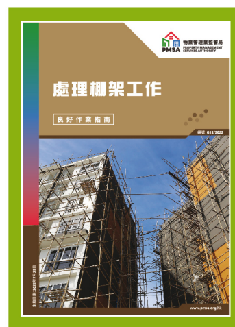
參考資料一 處理棚架工作良好作業指南