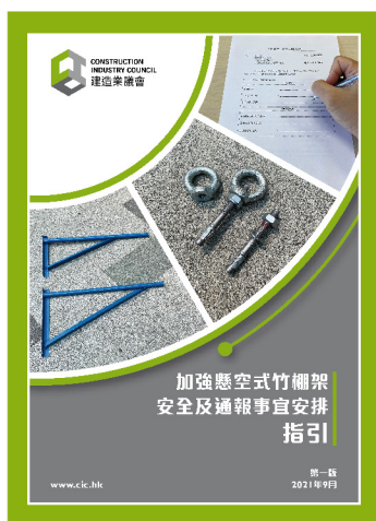
參考資料一 加強懸空式竹棚架安全及 通報事宜安排指引