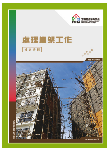
參考資料一 處理棚架工作操守守則